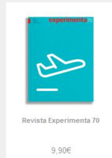
Revista Experimenta 70