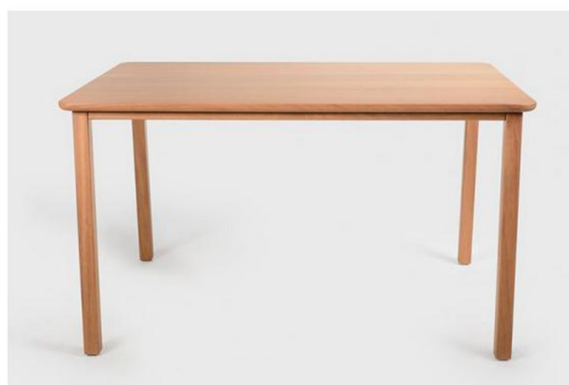
Colección Oma, de Silvia Ceñal para Oi Side, 2016