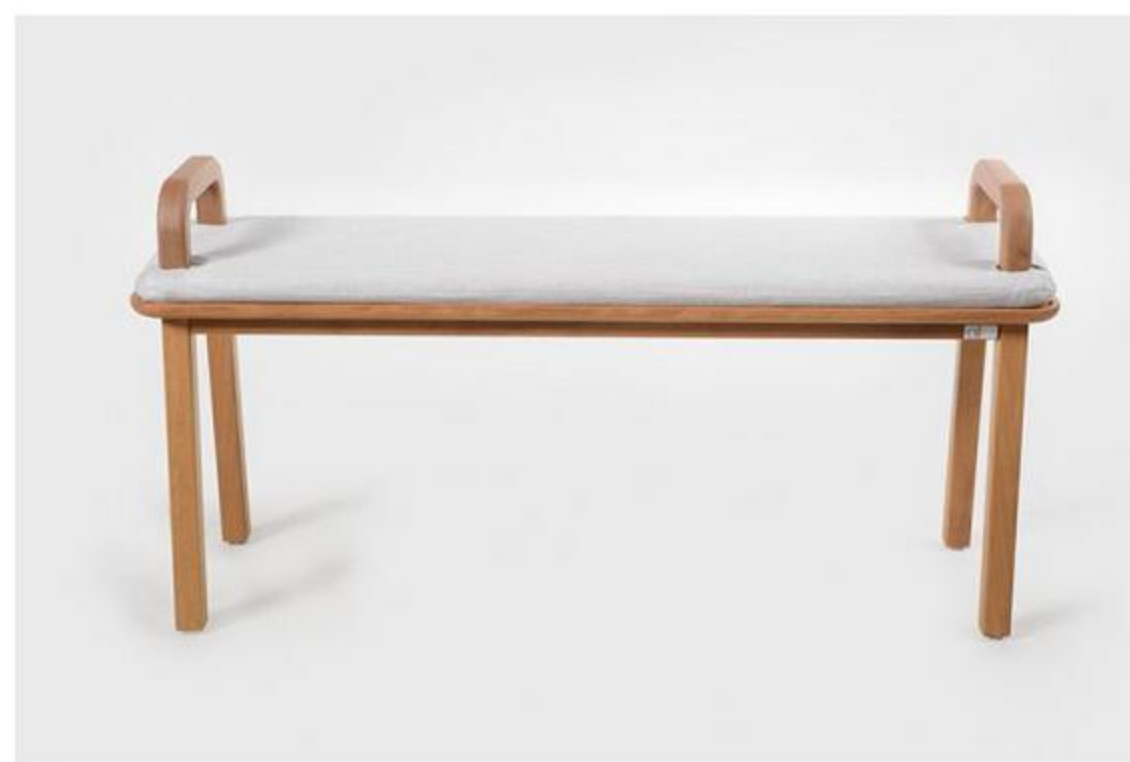
Colección Oma, de Silvia Ceñal para Oi Side, 2016