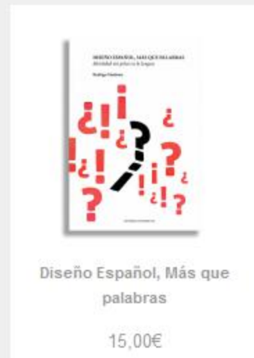
Diseño Español, Más que palabras