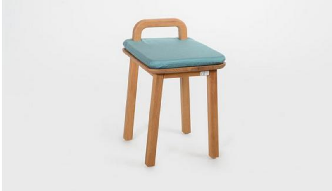
Colección Oma, de Silvia Ceñal para Oi Side, 2016