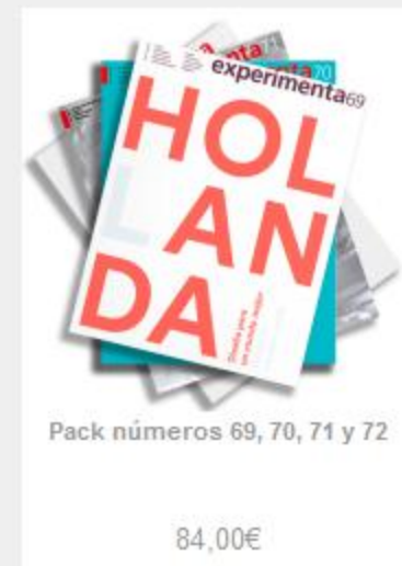
Pack números 69, 70, 71 y 72